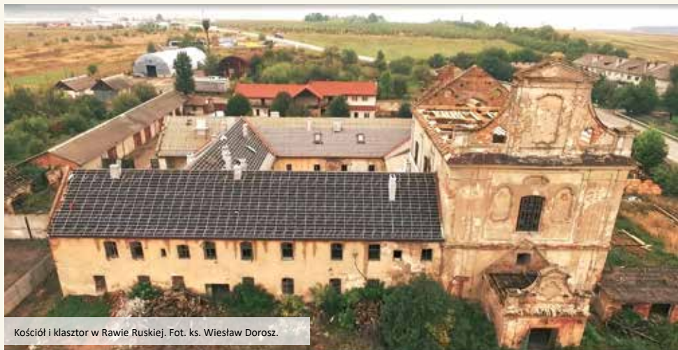
Kościół i klasztor w Rawie Ruskiej.