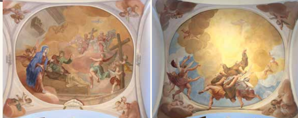
Odrestaurowane freski.