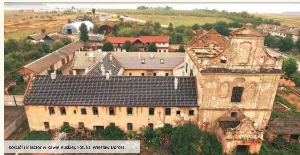
Kościół i klasztor w Rawie Ruskiej.

„Bliźniacze klasztory: Węgrów i Rawa Ruska - wykorzystanie potencjału dziedzictwa historycznego zakonu Reformatów dla rozwoju turystyki i życia społeczno-kulturalnego w Polsce i Ukrainie”